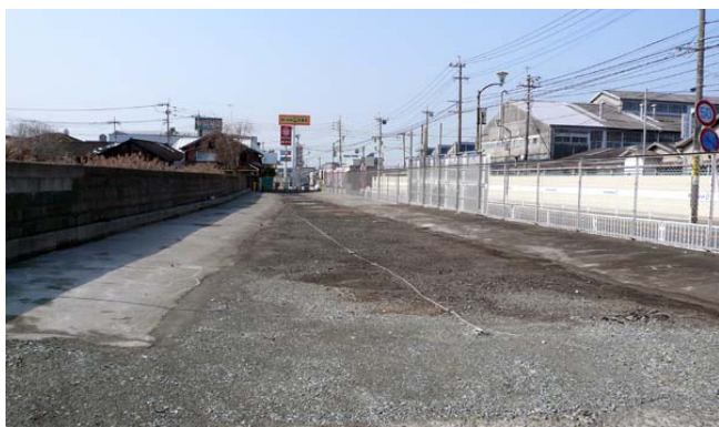
SNK専用駐車場 通り抜けができます。

荘島プラザからパソコン教室をリサーチパークへ移し、講座受講者は年間4000名にも達し、運営は軌道に乗り現在に至っています。