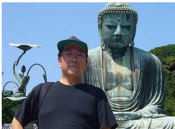
たばたぼさんはパソコンのものしり博士